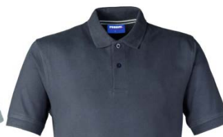
16 – ANTRACITA