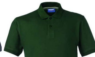
51 – BOTTLE GREEN