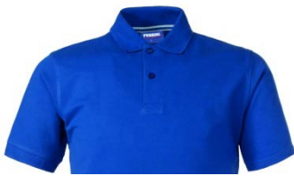
06 – AZUL REAL