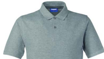
12 – MELANGE GREY