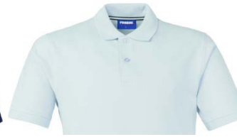
02 – WHITE