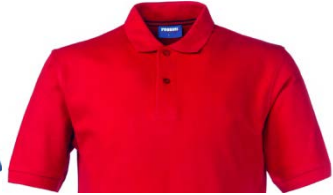
07 – ROJO