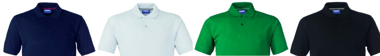
01 – BLU