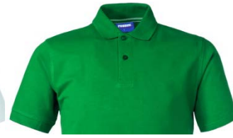
04 – VERDE