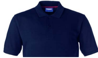
01 – BLUE

Short sleeve polo shirt with contrasting colour sweatband on the back of the collar closed with two buttons, ribbed armhole, side slits at the bottom in contrasting colour.