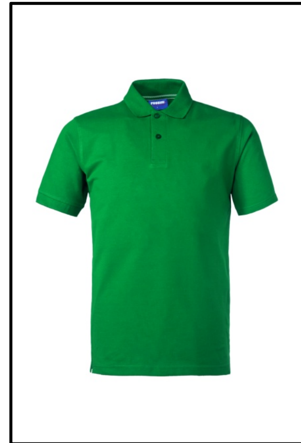
04 – VERDE