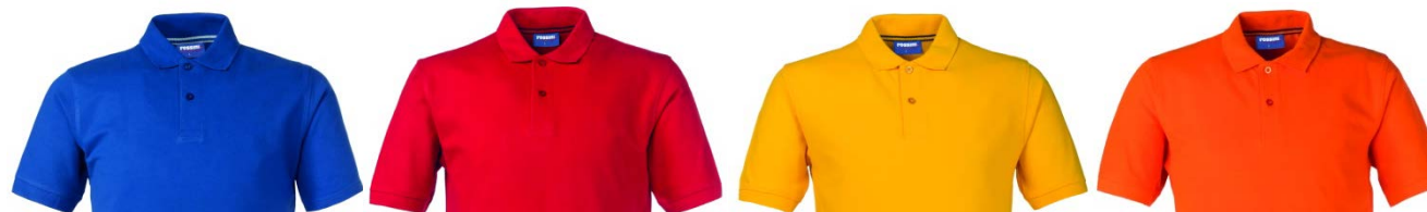
06 – ALBASTRU REGAL