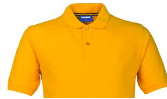
08 – YELLOW