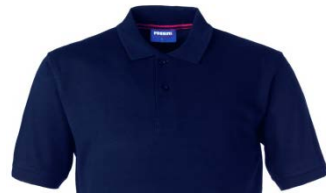
01 – AZUL