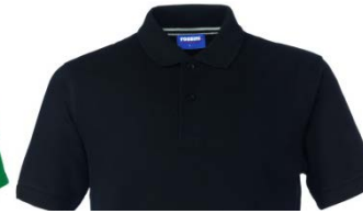
05 – NEGRO