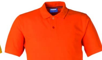
09 – NARANJA