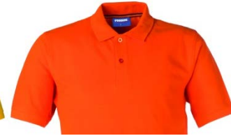
09 – ORANGE