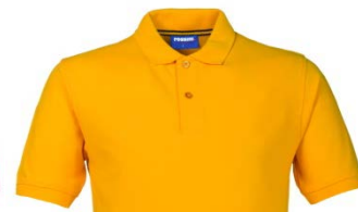
08 – AMARILLO